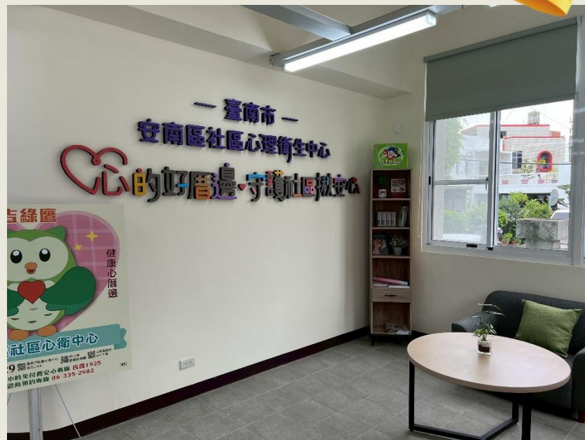
安南區原警察局安順派出所