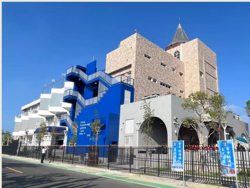
原歷史水景公園橡欣樓