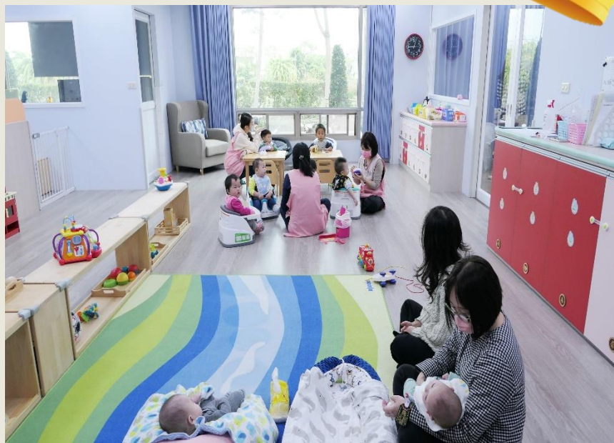
佳里區多摩市社區1樓