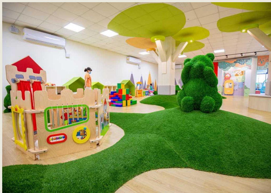
鹽水公有零售市場3樓