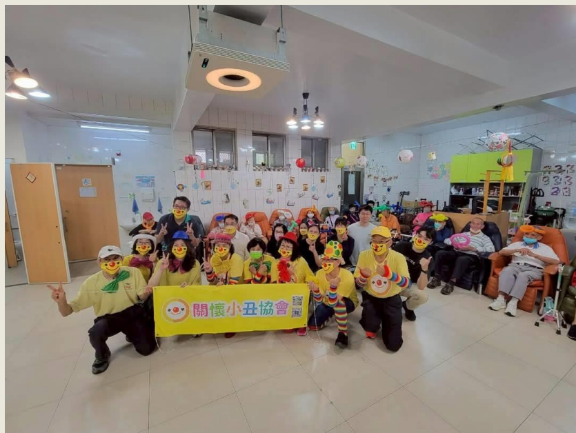
左鎮區光和里活動中心