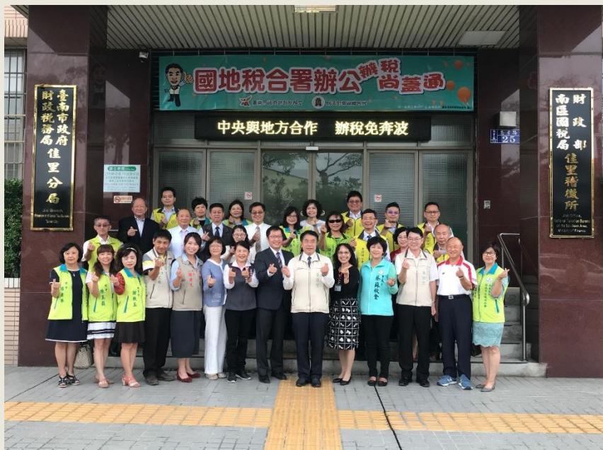
財政稅務局佳里分局辦公室