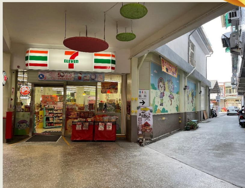
原龍崎公有零售市場