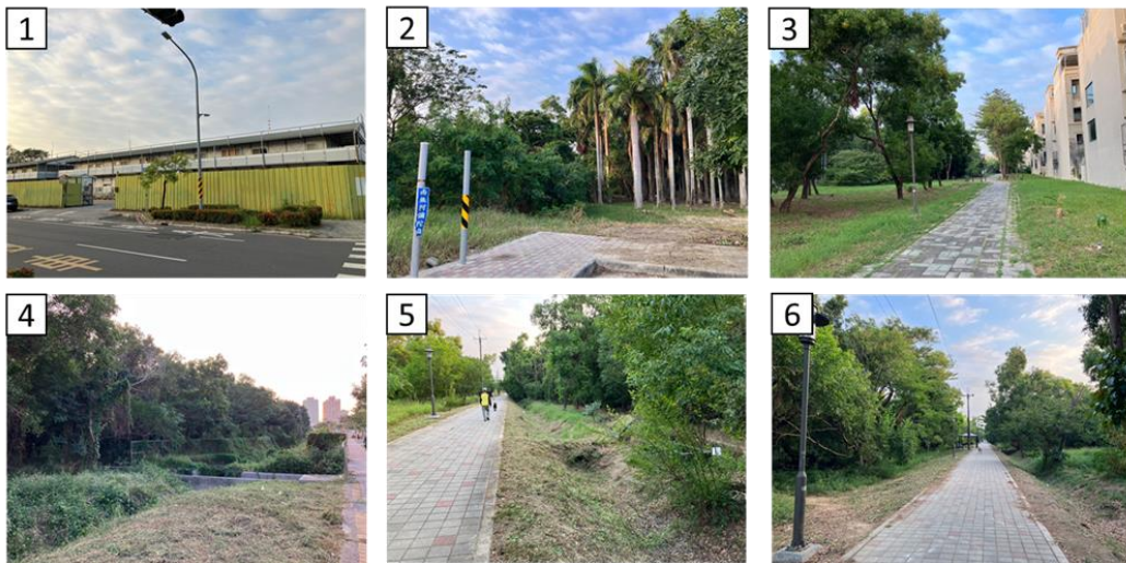
圖 1 本案基地位置及現況圖