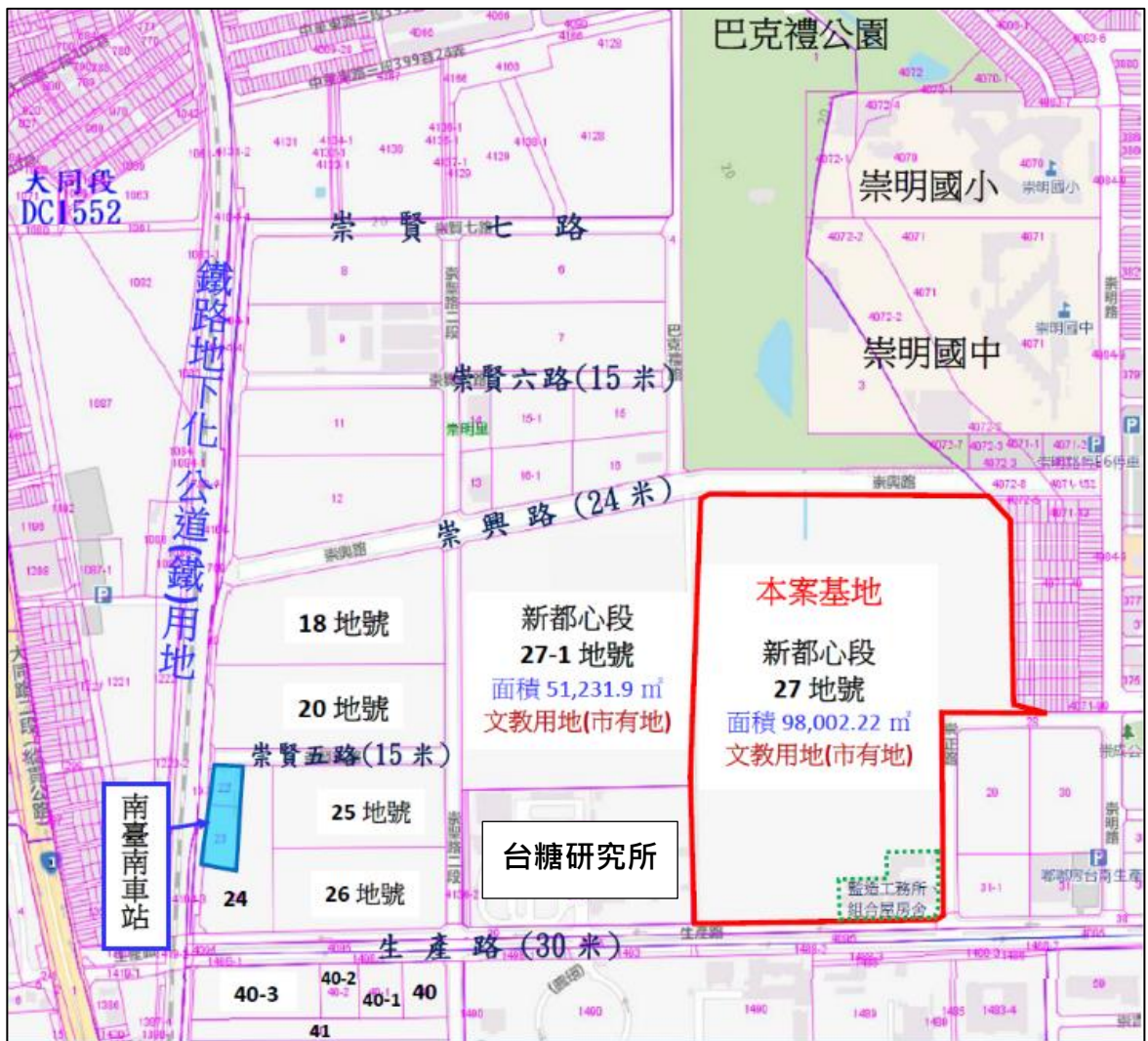
圖 1 本案基地位置圖

(一) 本案基地為臺南市東區新都心段 27 地號市有土地 (管理機關為本府教育局)，位於南臺南站副都心第一期區段徵收案範圍，面積 98,002.22 平方公尺，北側臨崇興路 (24 米寬)、南側臨生產路 (30 米寬)、東側臨崇正路，西側為同段 27-1 地號市有土地及台糖研究所。基地周遭以住商區土地為主，陸續開發建築中。